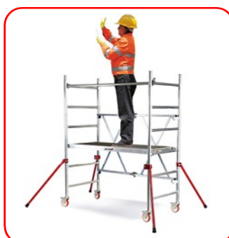
Roller 1,96 m (Módulo A)