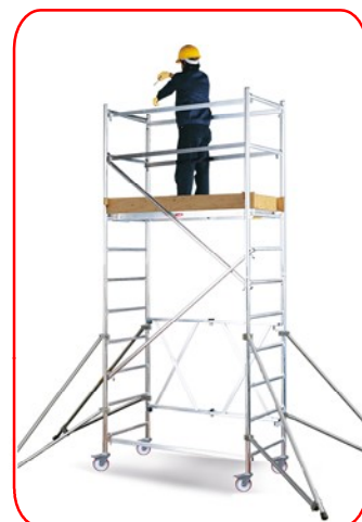
Roller 3,50 m (Módulos A+B)