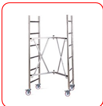
Módulo A plegable